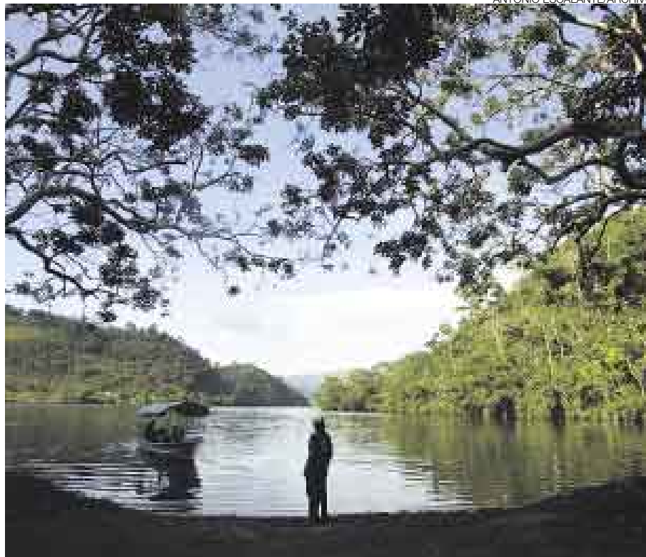
PAISAJE. El recorrido incluirá la visita a diversos escenarios de Tarapoto.

Los servicios enfocados en el turista que visite el Jardín Botánico Bioadventure incluirán una serie de actividades ligadas al cuidado del medio ambiente: desarrollo de biohuertos, talleres ecológicos, ases-